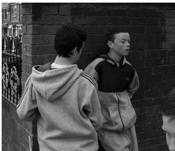
4. Stephen Dock Belfast, Ardoyne, 2014 © Stephen Dock