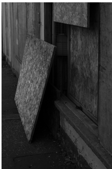
5. Belfast, Carrickfergus, polyptyque, 2016/2017 © Stephen Dock