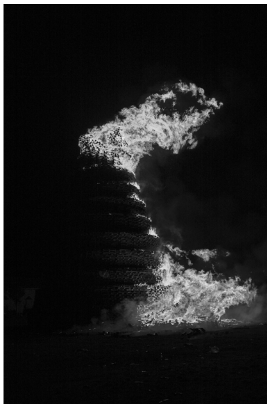
3. Stephen Dock Belfast, Shankill Road, Bonfire, 11th July 2014